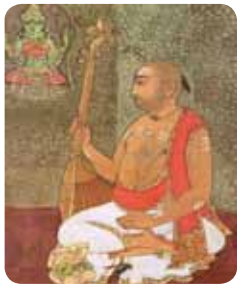
ಶ್ಯಾಮಾ ಶಾಸ್ತ್ರಿಗಳು (ಏಪ್ರಿಲ್ 26, 1762 - 1827)

ದೀಕ್ಷಿತರು ತಮ್ಮ ನವಾವರ್ಣ ಕೃತಿಗಳಲ್ಲಿ ಅವರ ಆರಾಧ್ಯದೇವತೆಯಾದಂಥಕ ಲಲಿತಾಂಜನೆಯ ಸೌಂದರ್ಯವನ್ನು ಅತಿ ಮನೋಹರವಾಗಿ ವರ್ಣಿಸಿದ್ದಾರೆ. ಇವರು ರಚಿಸಿರುವಂಥಕ ವಾತಾಪಿ ಗಣಪತಿಂ,ಶ್ರೀಕಾಂತಿಮತಿಂ, ಅಖಿಲಾಂಡೇಶ್ವರಿ ರಂಗನಾಯಕಂ, ಸೌಂದರರಾಜಂ ಆಶ್ರಯೇ, ಮಾನಸ ಗುರುಗುಹ, ಹಲವಾರು ಕೃತಿಗಳನ್ನು ನಾವು ಕೇಳುತ್ತಿದ್ದೇವೆ. ಇಂಥಕ ಮಹಾವ್ಯಕ್ತಿಯು ನರಕ ಚತುರ್ದಶಿಯೆಂದು ಜಗನ್ನಾತೆಗೆ ವಿಶೇಷ ಸೂಜೆ ಸಲ್ಲಿಸಿ, ಸಂಜೆ ತಮ್ಮ ಶಿಷ್ಯರನ್ನುಕರೆದು, ತಾವೇ ರಚಿಸಿದ ಪೋರ್ವಿಕಲ್ಯಾಣಿ ರಾಗದ “ಮೀನಾಕ್ಷಿ ಮೇಮುದಂ” ಕೃತಿಯನ್ನು ವಿಣೆಯಲ್ಲಿ ನುಡಿಸುತ್ತಾ, ಆ ಜಗನ್ನಾತೆಯ ಮಡಿಲಿನಲ್ಲಿ ಆನವಾದರು.