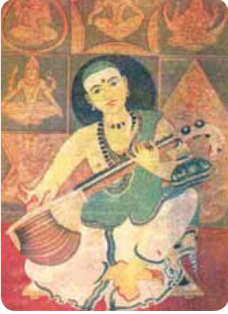
ಶ್ರೀ ಮುತ್ತುಸ್ವಾಮಿ ದೀಕ್ಷಿತರು: (1775 - 1834)

“ಎಂದರೋ ಮಹಾನುಭಾವನು, ಅಂದರಿಕ ವಂದನಮುಲು “ ಎಂಬ ಅಮೋಘವಾದ ಕೃತಿಯನ್ನು ಶ್ರೀ ತ್ಯಾಗರಾಜರು ಬಹುಷಃ ಅವರ ಸಮಕಾಲೀನರಾದಂಥಕ ಶ್ರೀ ಮುತ್ತುಸ್ವಾಮಿ ದೀಕ್ಷಿತರು ಹಾಗೂ ಶ್ರೀ ಶ್ಯಾಮಾಶಾಸ್ತ್ರಿಯವರನ್ನು ಮನಸ್ಸಿನಲ್ಲಟ್ಟುಕೊಂಡೇ ರಚಿಸಿರಬಹುದೇನೋ!! ಇಂಥಕ ಅನರ್ಘ್ಯ ರತ್ನಗಳ ಒಂದು ಕಿರು ಪರಿಚಯ.