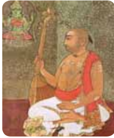
ಶ್ಯಾಮಾ ಶಾಸ್ತ್ರಿಗಳು (ಏಪ್ರಿಲ್ 26, 1762 - 1827)

ದೀಕ್ಷಿತರು ತಮ್ಮ ನವಾವರ್ಣ ಕೃತಿಗಳಲ್ಲಿ ಅವರ ಆರಾಧ್ಯದೇವತೆಯಾದಂಥಕ ಲಲಿತಾಂಜನೆಯ ಸೌಂದರ್ಯವನ್ನು ಅತಿ ಮನೋಹರವಾಗಿ ವರ್ಣಿಸಿದ್ದಾರೆ. ಇವರು ರಚಿಸಿರುವಂಥಕ ವಾತಾಪಿ ಗಣಪತಿಂ,ಶ್ರೀಕಾಂತಿಮತಿಂ, ಅಖಿಲಾಂಡೇಶ್ವರಿ ರಂಗನಾಯಕಂ, ಸೌಂದರರಾಜಂ ಆಶ್ರಯೇ, ಮಾನಸ ಗುರುಗುಹ, ಹಲವಾರು ಕೃತಿಗಳನ್ನು ನಾವು ಕೇಳುತ್ತಿದ್ದೇವೆ. ಇಂಥಕ ಮಹಾವ್ಯಕ್ತಿಯು ನರಕ ಚತುರ್ದಶಿಯೆಂದು ಜಗನ್ನಾತೆಗೆ ವಿಶೇಷ ಸೂಜೆ ಸಲ್ಲಿಸಿ, ಸಂಜೆ ತಮ್ಮ ಶಿಷ್ಯರನ್ನುಕರೆದು, ತಾವೇ ರಚಿಸಿದ ಪೋರ್ವಿಕಲ್ಯಾಣಿ ರಾಗದ “ಮೀನಾಕ್ಷಿ ಮೇಮುದಂ” ಕೃತಿಯನ್ನು ವಿಣೆಯಲ್ಲಿ ನುಡಿಸುತ್ತಾ, ಆ ಜಗನ್ನಾತೆಯ ಮಡಿಲಿನಲ್ಲಿ ಆನವಾದರು.