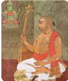
ಶ್ಯಾಮಾ ಶಾಸ್ತ್ರಿಗಳು (ಏಪ್ರಿಲ್ 26, 1762 - 1827)

ದೀಕ್ಷಿತರು ತಮ್ಮ ನವಾವರ್ಣ ಕೃತಿಗಳಲ್ಲಿ ಅವರ ಆರಾಧ್ಯದೇವತೆಯಾದಂಥಕ ಲಲಿತಾಂಜನೆಯ ಸೌಂದರ್ಯವನ್ನು ಅತಿ ಮನೋಹರವಾಗಿ ವರ್ಣಿಸಿದ್ದಾರೆ. ಇವರು ರಚಿಸಿರುವಂಥಕ ವಾತಾಪಿ ಗಣಪತಿಂ,ಶ್ರೀಕಾಂತಿಮತಿಂ, ಅಖಿಲಾಂಡೇಶ್ವರಿ ರಂಗನಾಯಕಂ, ಸೌಂದರರಾಜಂ ಆಶ್ರಯೇ, ಮಾನಸ ಗುರುಗುಹ, ಹಲವಾರು ಕೃತಿಗಳನ್ನು ನಾವು ಕೇಳುತ್ತಿದ್ದೇವೆ. ಇಂಥಕ ಮಹಾವ್ಯಕ್ತಿಯು ನರಕ ಚತುರ್ದಶಿಯೆಂದು ಜಗನ್ನಾತೆಗೆ ವಿಶೇಷ ಸೂಜೆ ಸಲ್ಲಿಸಿ, ಸಂಜೆ ತಮ್ಮ ಶಿಷ್ಯರನ್ನುಕರೆದು, ತಾವೇ ರಚಿಸಿದ ಪೋರ್ವಿಕಲ್ಯಾಣಿ ರಾಗದ “ಮೀನಾಕ್ಷಿ ಮೇಮುದಂ” ಕೃತಿಯನ್ನು ವಿಣೆಯಲ್ಲಿ ನುಡಿಸುತ್ತಾ, ಆ ಜಗನ್ನಾತೆಯ ಮಡಿಲಿನಲ್ಲಿ ಆನವಾದರು.